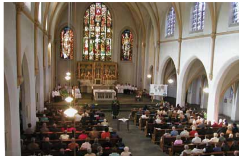
St. Antonius heute: Ein Blick von der Orgelbühne zeigt Chorfenster und Altar

www.sanktantoniusdortmund.homepage.t-online.de