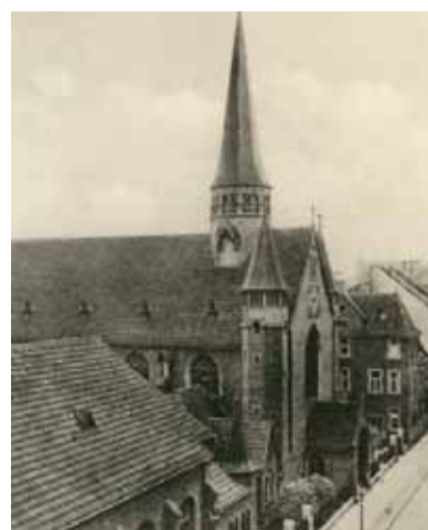
St. Antonius ca. 1933

Ist Ihnen schon einmal die Kirche in der Holsteiner Straße aufgefallen? Falls nein liegt es vielleicht daran, dass der Turm nur ca. 40 m hoch ist, was Bergschäden geschuldet ist. Jedoch: Ein genauer Blick lohnt sich. St. Antonius steht mitsamt den benachbarten Gebäuden als seltenes Beispiel eines historischen Kirchengemeindezentrums aus der Anfangszeit des vorigen Jahrhunderts unter Denkmalschutz. Zur Gründungszeit 1908 bot das Zentrum bis zu 9000 Gemeindegliedern eine Heimat.