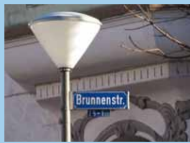
...und eine gute Adresse?!