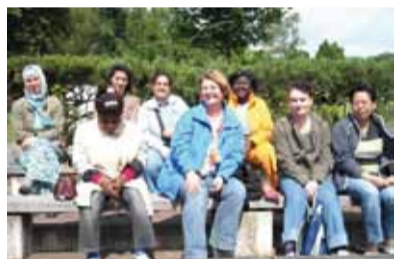
Ausflug in den Westfalenpark...

tungen zu den Themen Gesundheit, Ernährung, Erziehung oder zu Einrichtungen in der Umgebung durchgeführt. Rat und Hilfe kann man in den wöchentlichen Frühstückstreffen durch andere Eltern erfahren. Vertrauliche Unterstützung gibt es in Einzelgesprächen mit den Mitarbeiterinnen der Elterncafés. Die Eltern schätzen diese Angebote sehr. Sie kommen besonders gern, wenn bei einem gemeinsamen Essen das Gespräch und der Spaß im Vordergrund stehen. Dann haben sie die Möglichkeit Menschen aus verschiedenen Nationen und Kulturen kennen zu lernen, ihr Essen zu kosten, ihre Sprache zu hören und ihre Gebräuche zu erfahren. Schulen für die ganze Familie sind sie also, unsere Grundschulen.