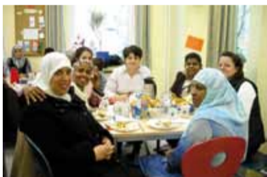
... und beim gemeinsamen Frühstück